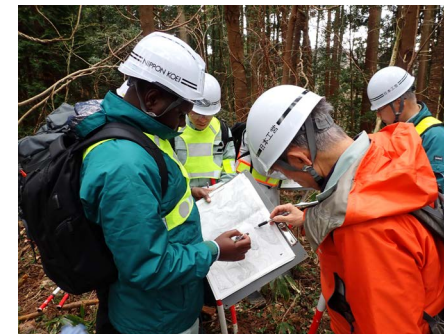
災害支援の現場（能登半島）

私たちは、「世界をすみよくする」をミッションに、これからも変化を恐れず、誠意と技術をもって社会課題に向き合うことで持続可能な未来の実現に貢献してまいります。