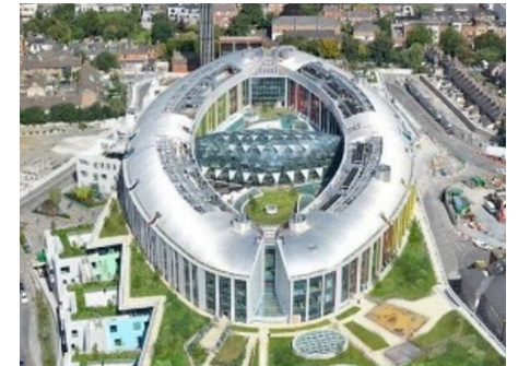
ダブリン国立小児病院（アイルランド）