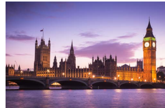
ウェストミンスター宮殿 (イギリス)

東日本大震災からの復興、気候変動対策、都市再生など、複雑化する課題に対応。グループの共創力を高め、サステナビリティとレジリエンスを備えた社会づくりに貢献しました。