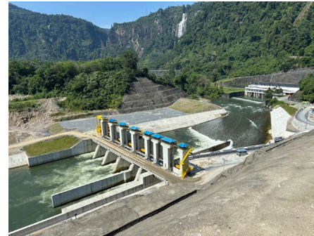
アサハン第3水力発電所（インドネシア）