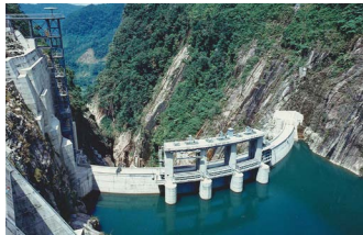
アサハン第2水力発電 (インドネシア)