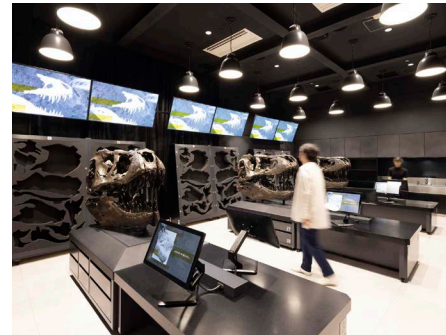
福井県立恐竜博物館 新館 化石研究体験