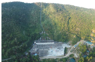
バラーチャン水力発電 (ミャンマー)

人々の暮らしを守る一当グループのサステナビリティに対する姿勢の原点です。戦後の国土復興やアジア各国の発展に欠かせない生活基盤整備への寄与を通じて、持続可能な未来への第一歩を踏み出しました。