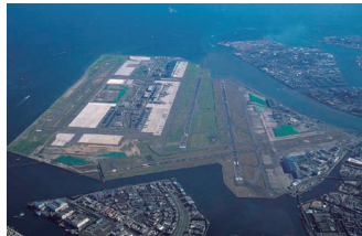
東京国際 (羽田) 空港 B 滑走路